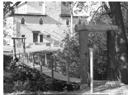
Le pont aujourd'hui