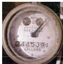
Compteur en gallons